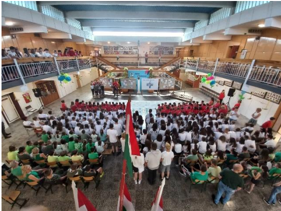
Nemzeti összetartozás napja