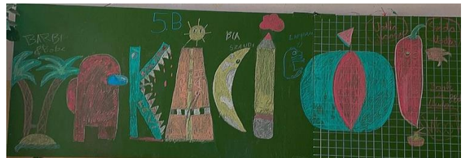
Erdei vándortábor a Zselicben június 29-július 6.