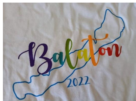
Radnóti nyári tábor Fonyódon